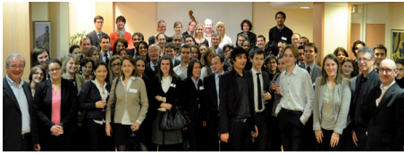
«Groupe Paris» lors de l'afterwork du 9/03/2011